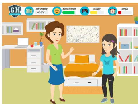
Screenshots aus der Finanzbildungs-App